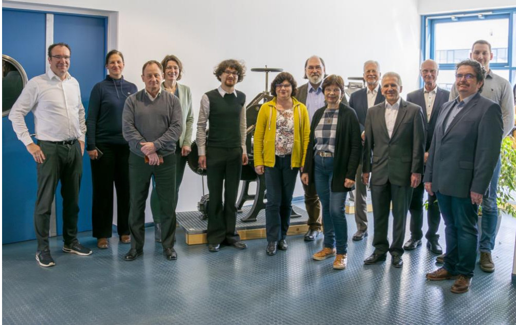
Auditoren der Zuse-Gemeinschaft beim Erfahrungsaustausch im SID

Sächsisches Institut für die Druckindustrie