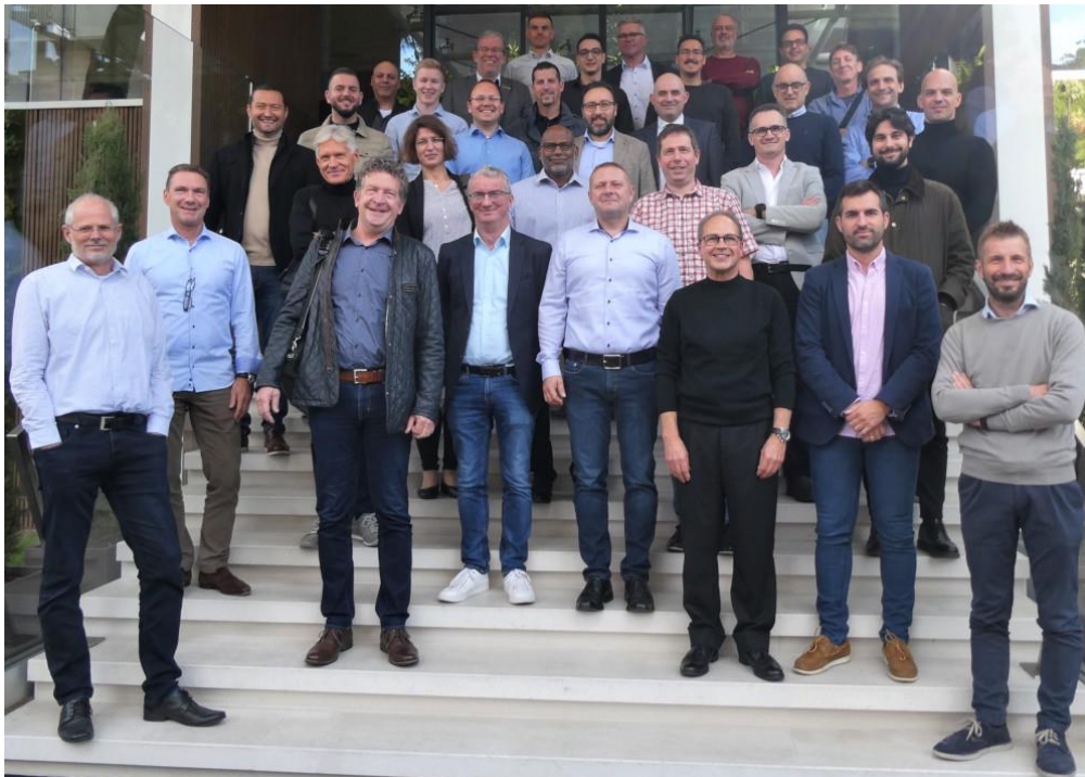
Die Teilnehmer des IPA Technical Committee meetings in Ricchione

Am 7. und 8. November fand das Treffen des technischen Komitees des IPA statt. Das SID war mit dabei.