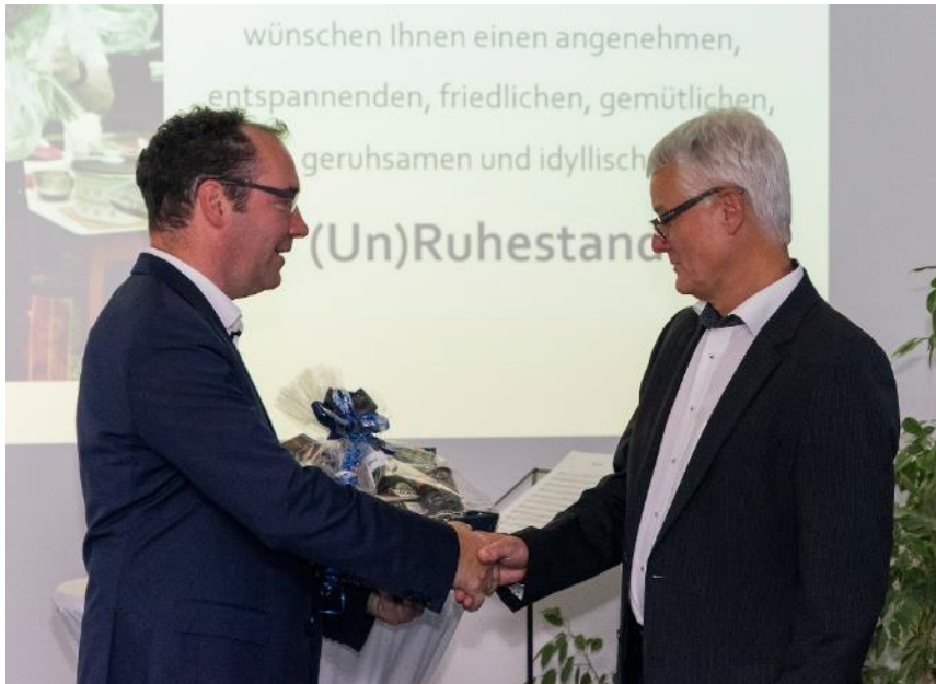
Bildunterschrift: Dr. Kaulitz dankte seinem Vorgänger für die geleistete Arbeit und das entgegengebrachte Vertrauen während der Übergangszeit

Sächsisches Institut für die Druckindustrie