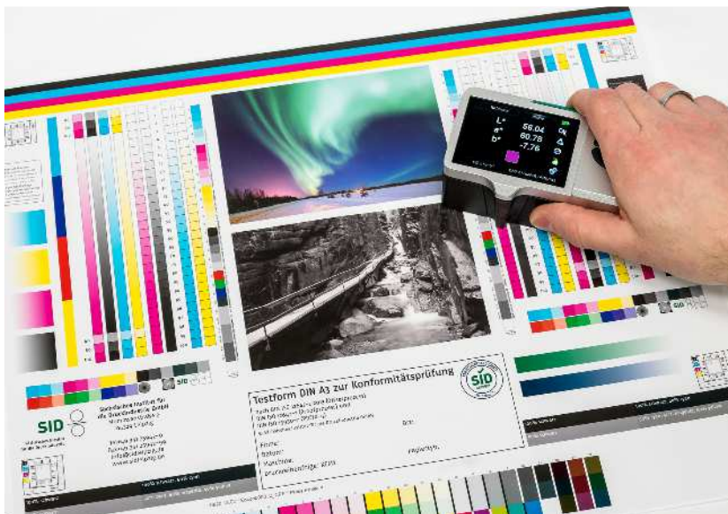
Bild 2: Messung auf einem Testbogen im Rahmen einer PSO-Zertifizierung

Bild 1: Das begehrte Siegel für das normgerechte Arbeiten im Prüflabor