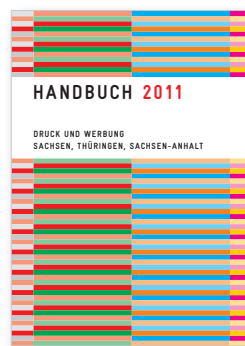
Handbuch 2011 Druck und Werbung Sachsen, Thüringen, Sachsen-Anhalt