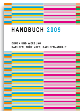
Handbuch 2009 Druck und Werbung Sachsen, Thüringen, Sachsen-Anhalt