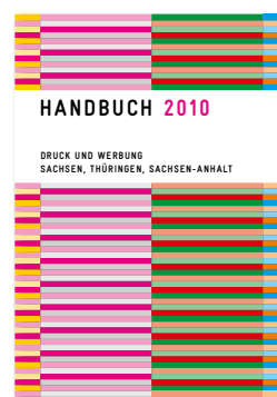
Handbuch 2010 Druck und Werbung Sachsen, Thüringen, Sachsen-Anhalt